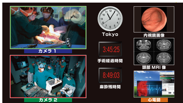
画面レイアウトイメージ