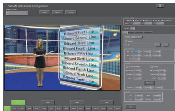
GUI画面でのプレビュー