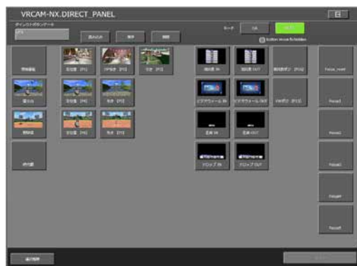
ダイレクトボタン