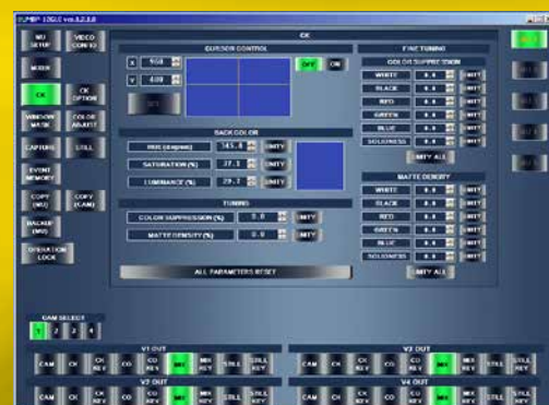
クロマキー設定画面