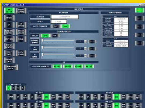
MBP-100CK セットアップ画面